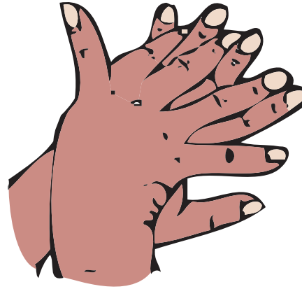
2 Права долоня по тильній стороні лівої руки і навпаки