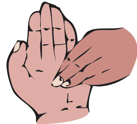
6. По черзі, круговими рухами терти долоню