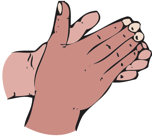
1. Терти долонею об долоню