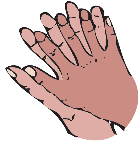
3. Терти внутрішні поверхні пальців рухами вгору і вниз